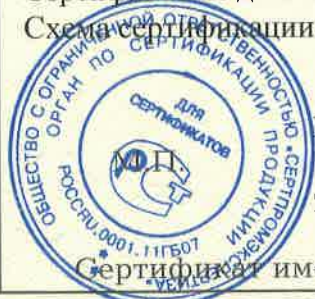
Схема сертификации: За.

Сертификат не действителен без Ех-приложения (3 листа).